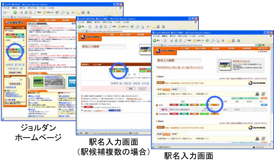
ジョルダン ホームページ