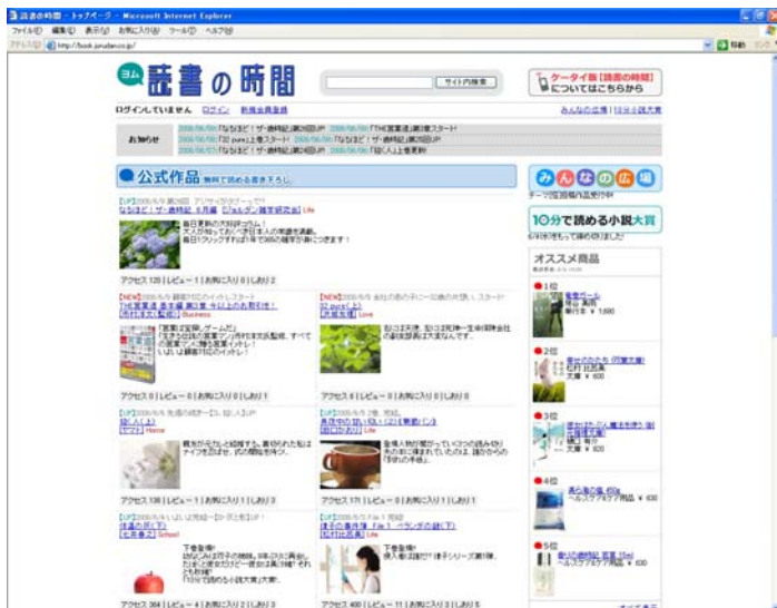
【読書の時間】PC版トップページ

今後も「読書の時間」では、PCと携帯、双方のプラットフォーム連携を強化し、多彩なジャンルの作品を拡充していき、ユーザーが様々な本・書籍作品をどんな時でも気軽に楽しめる環境を提供して参ります。