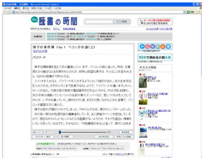
【読書の時間】PC版作品閲覧ページ