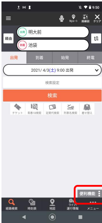
(1) アプリトップから「便利機能」を選択