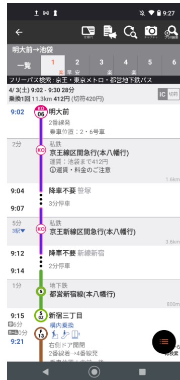
(4) 設定したフリーパスで利用可能な範囲に限定した検索結果を表示

※ 画面はAndroidアプリのものです。iOSアプリの場合、画面に若干の違いがあります。