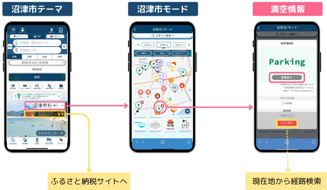
図1:ジョルダン乗換案内アプリ「沼津市モード」