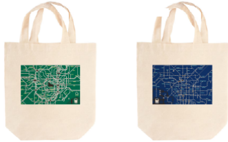
路線図トートバッグ 各1,800円